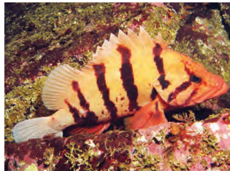
Sébaste-tigre ( Sebastes nigrocinctus )

Mesure jusqu'à 64 cm. Brun foncé à noir moucheté avec des zones pâles sur la tête et/ou sous la nageoire dorsale supérieure, la nageoire dorsale épineuse est profondément échancrée. Taches rousses sur la tête et/ou sous la mâchoire inférieure, particulièrement lorsqu'ils sont juvéniles.