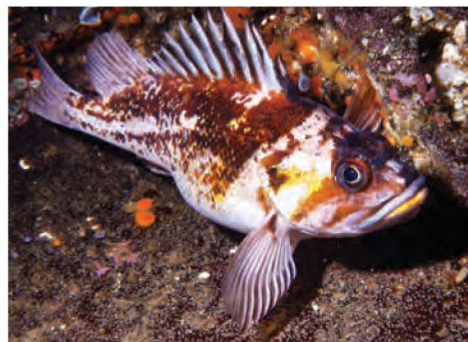
Sébaste cuivré ( Sebastes caurinus )

Mesure jusqu'à 61 cm. Corps rose, blanc à brun rouge avec 5 bandes verticales rouge foncé ou noires et 2 bandes partant des yeux.