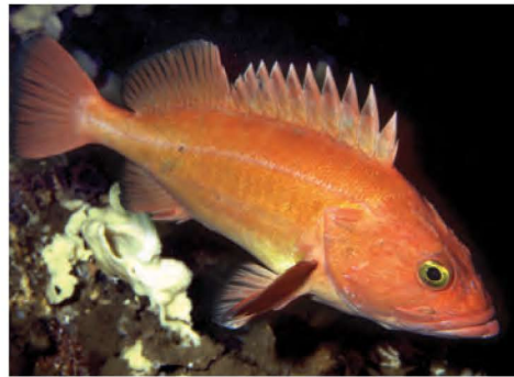
Sébaste aux yeux jaunes ( Sebastes ruberrimus )

Mesure jusqu'à 91 cm. Jaune-orange, rouge-orangé à rouge foncé avec des yeux jaune vif. Les juvéniles sont rouges avec 2 bandes claires.