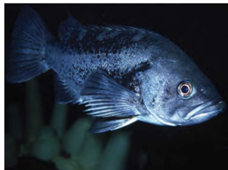
Sébaste noir ( Sebastes melanops )

Mesure jusqu'à 66 cm. Brun à cuivré avec des taches roses ou jaunes. Rayure pâle sur les deux derniers tiers du corps le long de la ligne latérale.