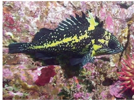
Sébaste à bandes jaunes ( Sebastes nebulosus )

Mesure jusqu'à 91 cm. Jaune-orange, rouge-orangé à rouge foncé avec des yeux jaune vif. Les juvéniles sont rouges avec 2 bandes claires.