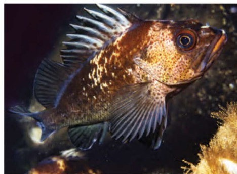
Sébaste à dos épineux ( Sebastes maliger )

Mesure jusqu'à 45 cm. Corps noir, tacheté de jaune et de blanc. Rayure jaune vers le bas de la nageoire dorsale qui revient le long de la ligne latérale.